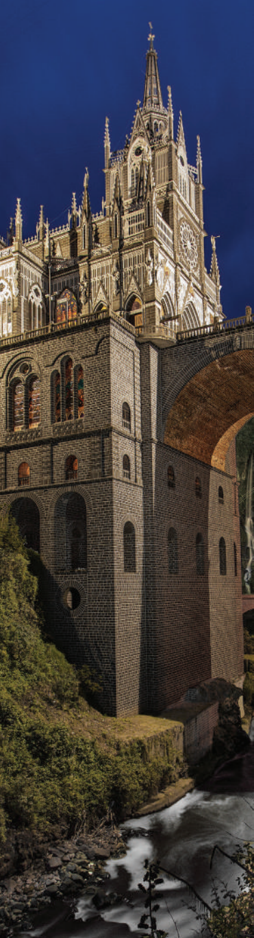
Templo de Nuestra Señora de las Lajas. Ipiales, Nariño. Edgar Gabriel Illescas Torres.

de arte religioso de origen colonial, y en los detalles del arte quiteño aprendido por los artistas nariñenses, y expuesto en pinturas, tallas en madera y hermosas piezas que dan cuenta de un gran fervor. Precisamente a Pasto se le conoce como la Ciudad Teológica de Colombia, por sus fuertes tradiciones católicas, evidentes en sus iglesias: