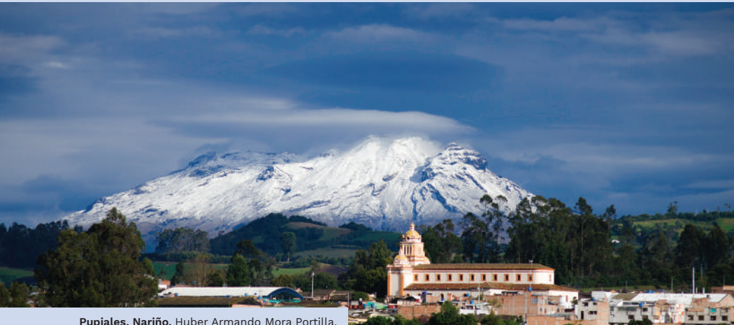
Pupiales, Nariño. Huber Armando Mora Portilla.

que Nariño concentra más de 1.600 especies, Caquetá 1.500 y las zonas exploradas de Putumayo 621. Aquí la naturaleza parece conservar todavía su dominio majestuoso, y al mismo tiempo los saberes ancestrales, costumbres y tradiciones que empoderan a sus gentes y las hacen guardianes de los tesoros del sur colombiano [2] .