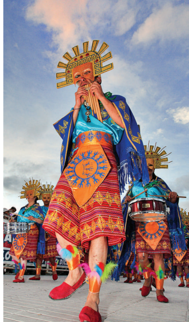
Carnaval de Negros y Blancos, Pasto, Nariño.