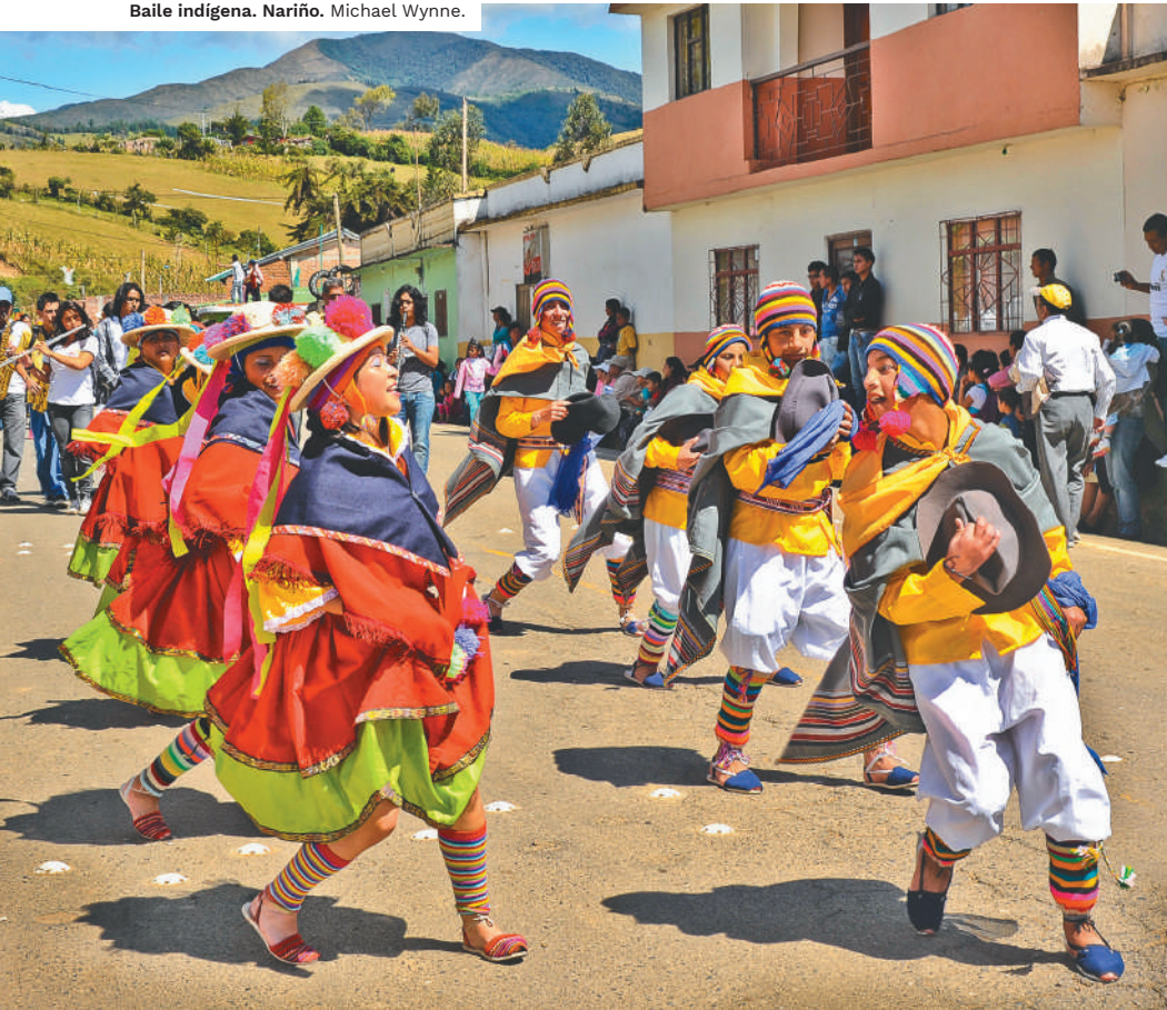
Baile indígena. Nariño. Michael Wynne.

El Cabildo Mayor de los Ingas ubicado en Santiago es una de las cuatro poblaciones que conforman el valle; aún conserva el carácter místico y, si el viajero lo desea, puede participar en una ceremonia de medicina tradicional, bajo la orientación de un