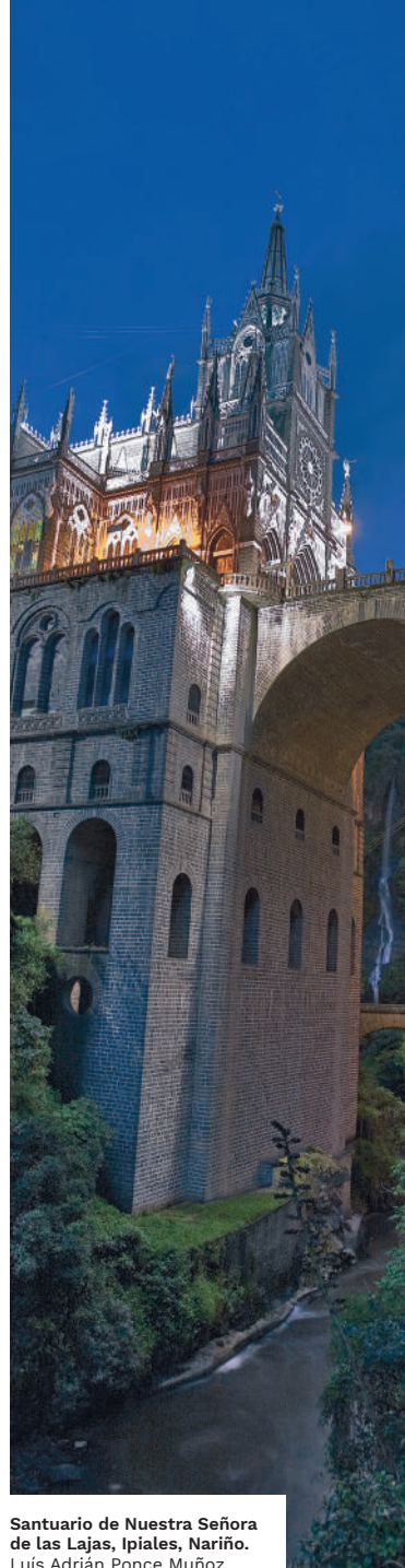
Santuario de Nuestra Señora de las Lajas, Ipiales, Nariño. Luis Adrián Ponce Muñoz.

En este municipio fronterizo se lleva a cabo el Carnaval multicolor de la frontera , del 2 al 7 de enero. El talento artístico ipialeño se despliega en una colorida muestra de disfraces, comparsas, murgas, carrozas, años viejos, viudas y testamentos que hacen la antesala. En los días siguientes, en el Carnaval de la Juventud participan instituciones educativas con muestra de danza y folclor. En el carnaval de la ex Provincia de Obando desfilan carrozas conmemorando los territorios que pertenecieron a esa provincia, algunos del norte del Ecuador y los cabildos indígenas de diferentes municipios. En el Carnavallito, los niños son los protagonistas. Sigue el día de Negros y la entrada de la familia Ipial, que es representada con un desfile encabezado por el cacique, donde se recrean ritos, mitos, leyendas, creencias, costumbres y tradiciones de la cultura de los Pastos. La celebración cierra con el día de los Blancos, comparsas y carrozas, que son juzgadas y premiadas según la creatividad y originalidad de los