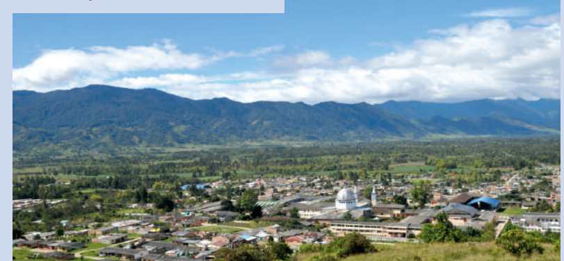
Valle de Sibundoy, Putumayo.

El parque central de este municipio, el de la Interculturalidad, exhibe ocho grandes esculturas en madera talladas por maestros artesanos Inga y Kamëntsä. El visitante puede adquirir como recordatorio máscaras y las llamadas “bancas de poder”, una clase de butaco redondo tallado en una pieza de madera para los rituales, y otras piezas talladas en madera de excelente calidad con coloridos acabados que resaltan la perfección de cada pieza [64] . En el año 2017, en cabeza del maestro Franco